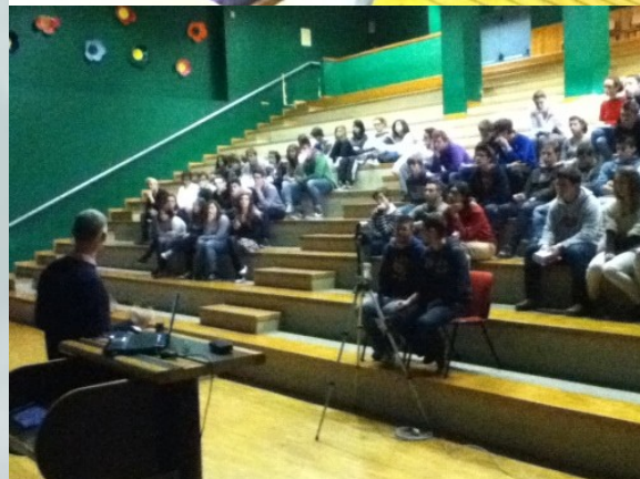
Alcuni momenti della conferenza al “Medi”